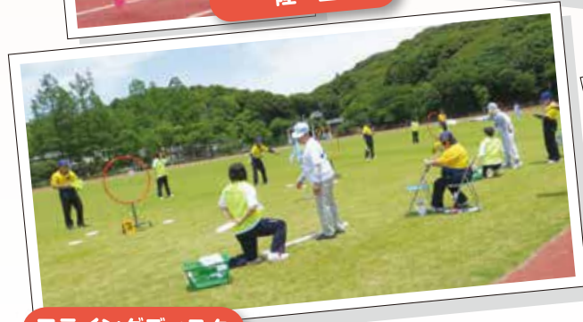
フライングディスク